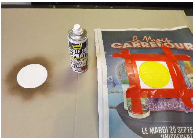
Après avoir enlevé le film de protection de la cocarde, pulvérisez légèrement celle-ci ainsi que son futur emplacement sur l'EPP.