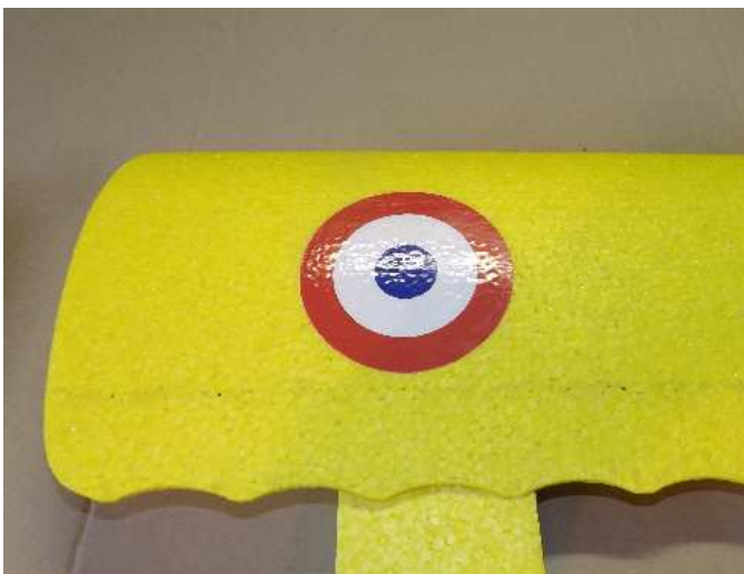
Le collage est fait, il ne reste plus qu'à enlever les protections et le pourtour de la cocarde. Voilà le résultat, cette cocarde tiendra très longtemps, même en extérieur.