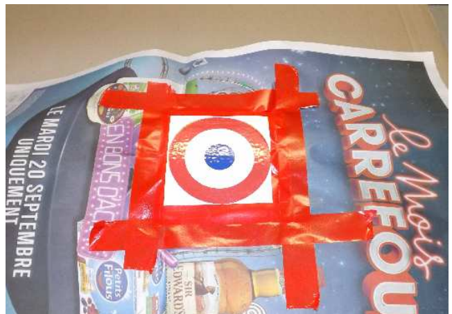
Attendre environ 10 minutes (la colle ne doit pas coller sous le doigt) et pressez ensuite la cocarde fermement. Maintenir quelques secondes.